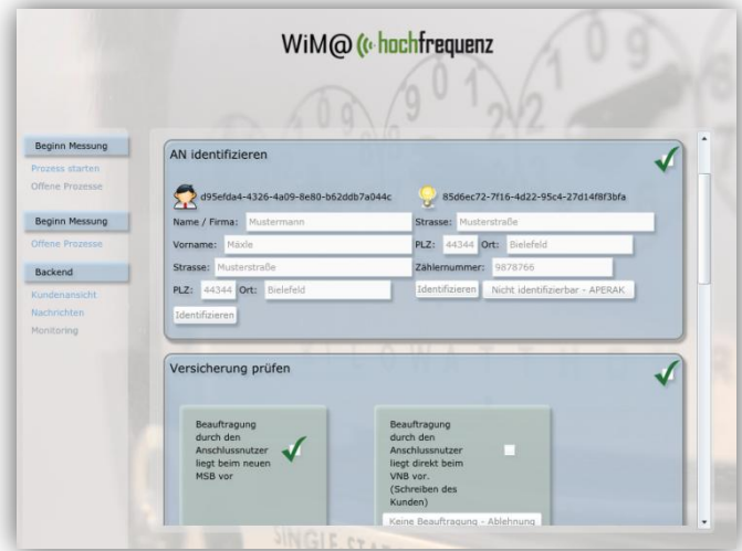
Abbildung 1 – Prozess „Beginn Messung“

Der Hochfrequenz WiM Prozessor ist eine SAP-unabhängige Lösung und erfordert keine Anpassungen in Ihren vorhandenen Systemen.